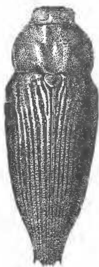
Cardiaspis Babaulti Théry.

Cardiaspis Babaulti nov. sp. longueur 19 mm 5; largeur 6 mm 5. — Forme semblable à celle de C. pisciformis Théry mais avec le pronotum rétréci à la base. Couleur d'un rouge cuivreux teinté de verdâtre, passant au rouge sur les bords postérieurs des élytres avec la suture d'un vert bleu bordé de cuivreux verdâtre; dessous cuivreux verdâtre.